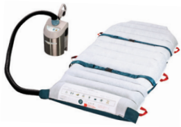
01 ホバーマットFULL34&エアサプライ 送気用エアサプライと34インチマット1枚の標準的なセットです。