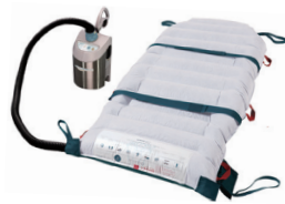
02 ホバーマットLINK&エアサプライ 送気用エアサプライとベッドに固定できるタイプのマット(LINK)1枚のセットです。