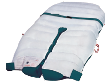
07 ホバーマットSPLIT 碎石位や開脚位を取りやすい下部が分かれる形状です。