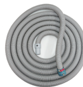
11 MRI用ロングホース MRIの検査台に患者を移乗させる際に、室外に置いたエアサプライから送気するためのホースです。