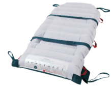
04 ホバーマットLINK ベッドに固定しギャッチアップ時のずり落ちを防止できます。