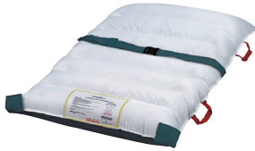
05 ホバーマットHALF 臀部までカバーするサイズです。