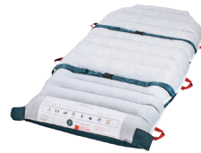
03 ホバーマットFULL34 幅が34インチの標準的なサイズです。