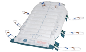
08 ホバーマットSLING リフトでも使用できるマットです。