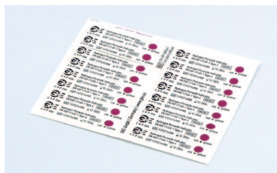
インジケータサイズ [原寸] 長さ65mm/幅14mm

滅菌器やプログラムに応じて4つの異なるSV値から選ぶことができます。裏面がシール状になっており、台帳にそのまま貼ることができます。