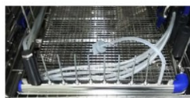
▲ 内腔洗浄の評価に使える フローPCD