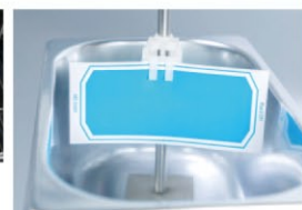
▲ 超音波洗浄用インジケータ