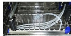
▲ 内腔洗浄の評価に使える フローPCD