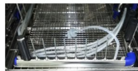
▲ 内腔洗浄の評価に使える フローPCD