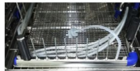
▲ 内腔洗浄の評価に使える フローPCD