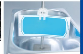
▲ 超音波洗浄用インジケータ