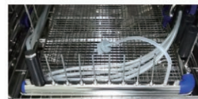
▲ 内腔洗浄の評価に使える フローPCD