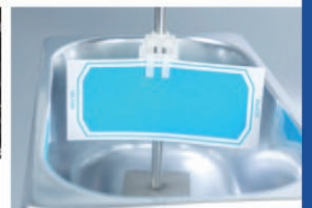
▲ 超音波洗浄用インジケータ