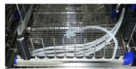
▲ 内腔洗浄の評価に使える フローPCD