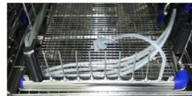
▲ 内腔洗浄の評価に使える フローPCD