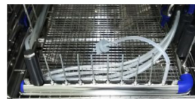
▲ 内腔洗浄の評価に使える フローPCD