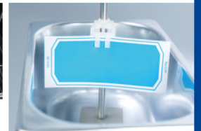
▲ 超音波洗浄用インジケータ