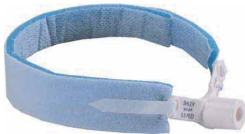
デイル・カニューレホルダー成人用