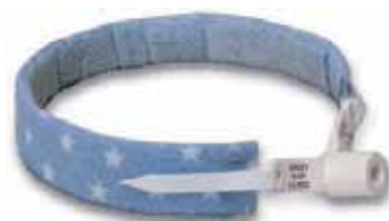
デイル・カニューレホルダー小児用 新生児用