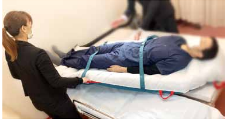
▲ ベッドからストレッチャーへの移乗