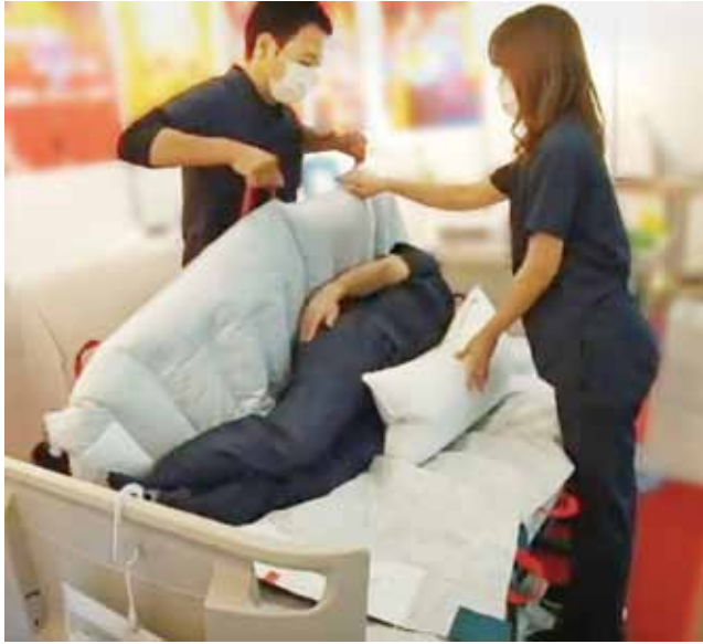
▲ 仰臥位から腹臥位への体位変換