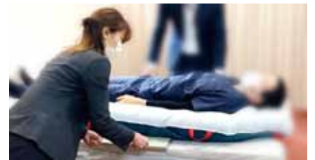
▲ X線カセットの挿入