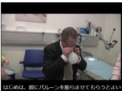
▲まず親が見本を見せる