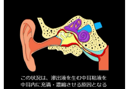
▲中耳内の様子の解説