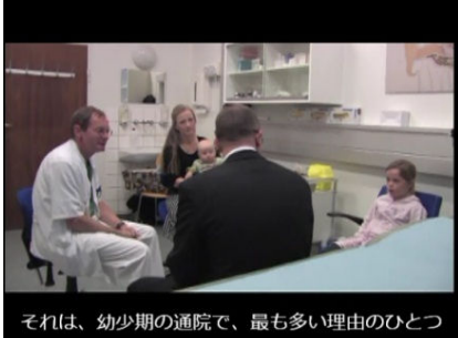
▲本人と家族への問診