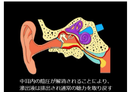
▲オトヴェントの解説