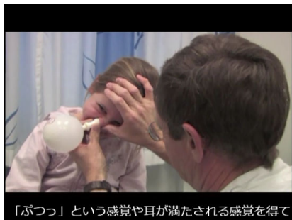
▲医師サポートでトライ