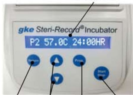
リターン ▲▼選択 プログラム 開始・停止