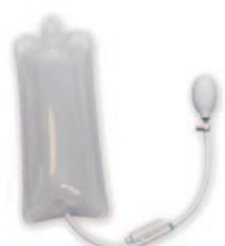
裏面が透明ビニルタイプもあります